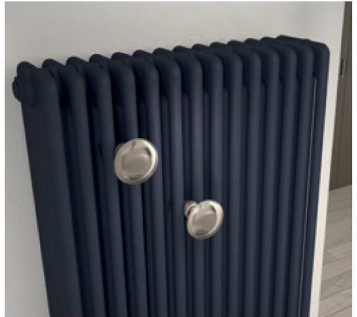
Radiatore Tesi 4, finitura Nero Opaco (cod. K1) Accessorio Hang Up Tondo 82, finitura Cromato (cod. 50)

Tesi 4 radiator, Opaque Black finished (cod. K1) Accessory Hang Up Tondo 82, Chrome-plated (cod. 50)