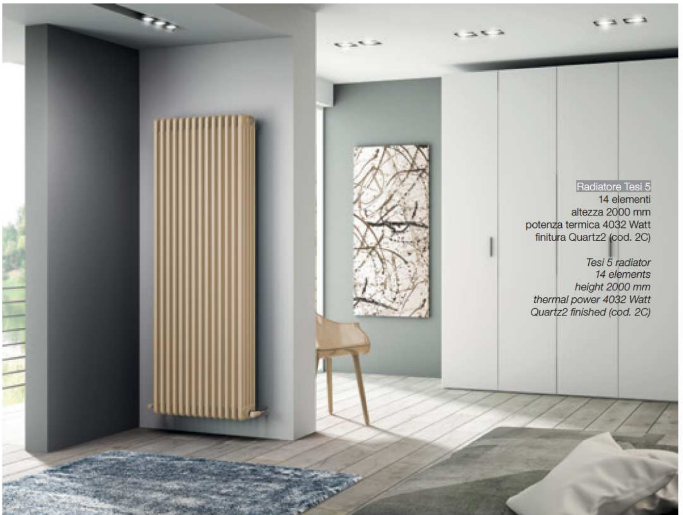
Radiatore Tesi 5 14 elementi altezza 2000 mm potenza termica 4032 Watt finitura Quartz2 (cod. 2C)

Tesi 4 radiator, Opaque Black finished (cod. K1) Accessory Hang Up Tondo 82, Chrome-plated (cod. 50)